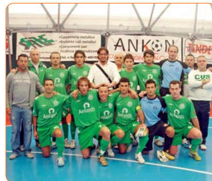
Foto della squadra 2007-08

Si è concluso sabato 19 Aprile il campionato di calcio a 5 serie B girone C. È stato un campionato avvincente sin dalla prima giornata sia in testa che in coda per via dell'alto livello qualitativo delle squadre che vi hanno partecipato. Come da pronostico a trionfare è stata l'Acqua & Sapone, squadra pescarese data come favorita numero uno già prima dell'inizio del torneo. Per gli abruzzesi, vincere il campionato non è stata certo una passeggiata, tallonati per tutte le 26 gare dal Civitanova. Alla fine entrambe le compagini sono arrivate a 65 punti ma in virtù degli scontri diretti a far festa è stata la squadra di Pescara, mentre Civitanova dovrà sudare e non poco negli imminenti play-off. Dicevamo prima dell'elevato tasso qualitativo delle squadre di questo girone ed a dimostrazione di ciò, si può dire che gran parte dei verdetti sono stati decisi solo all'ultima giornata. Anche a detta dei dirigenti di alcune società si è potuto riscontrare come a differenza dello scorso campionato, quello