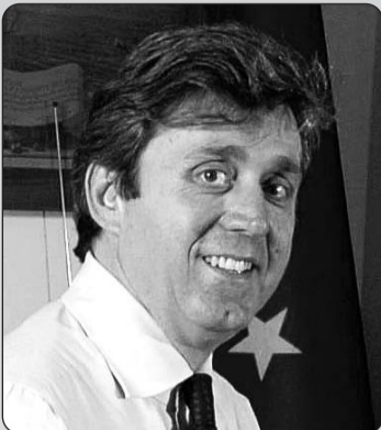
Fabio Sturani, Sindaco di Ancona