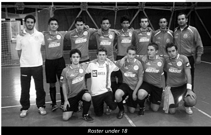
Roster under 18